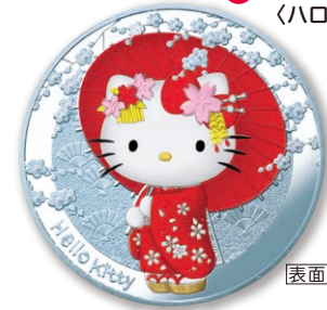
2 10ユーロカラー銀貨 〈日本〉