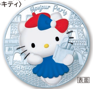
3 10ユーロカラー銀貨 〈フランス〉