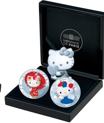
F 銀貨3種セット 123

フランスをイメージしたデザインのコイン。ベレー帽を被り、フランスパンやクロワッサンが入った紙袋を片手に、ワンピースを着たハローキティがお散歩。背景にはエッフェル塔や凱旋門など、花の都パリを代表する名所が描かれています。