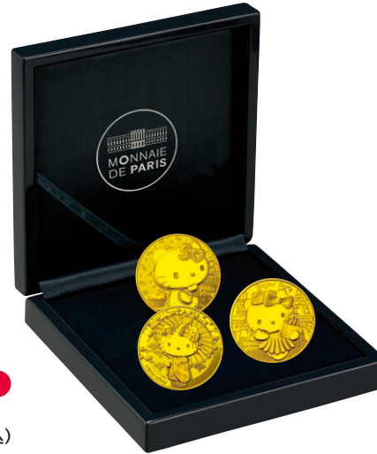
E 金貨3種セット BCD

日本をイメージしたデザインのコイン。和傘を差して下駄を履き、梅や桜が舞う振袖を着たハローキティがチャームリングです。背景には扇子や梅の花など、日本を象徴するモチーフが散りばめられています。