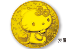
B 50ユーロ金貨 〈50周年〉