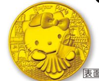
D 50ユーロ金貨 〈フランス〉