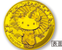
C 50ユーロ金貨 〈日本〉