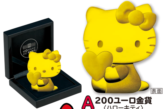
A 200ユーロ金貨 〈ハローキティ〉