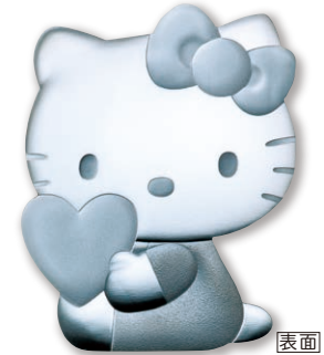
1 10ユーロ銀貨 〈ハローキティ〉