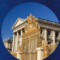
ヴェルサイユ宮殿