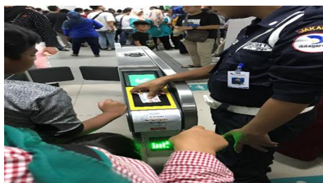
【改札口の様子。各銀行系電子マネーも利用可能。】

* Jadwal operasional MRT Jakarta resmi per Maret 2019. * Stasiun buka 15 menit sebelum kereta pertama dan tutup 15 menit setelah kereta terakhir.